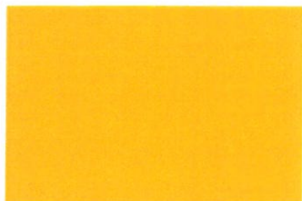
Kolor Kanarkowy R-248 G-196 B-0