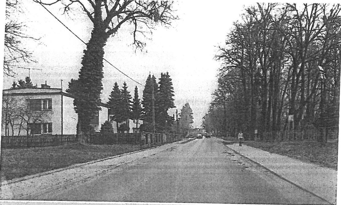
Widok drogi jadąc od strony centrum (DK 51)

Dokumentacja fotograficzna z wizji w terenie w dniu 16 kwietnia 2021 r.