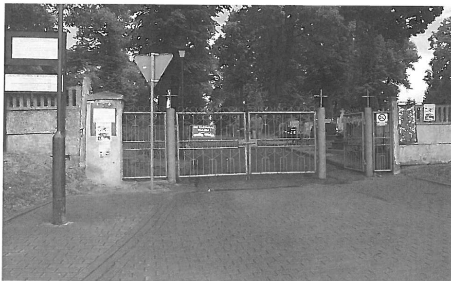
Brama główna cmentarza od strony ul. Kętrzyńskiej