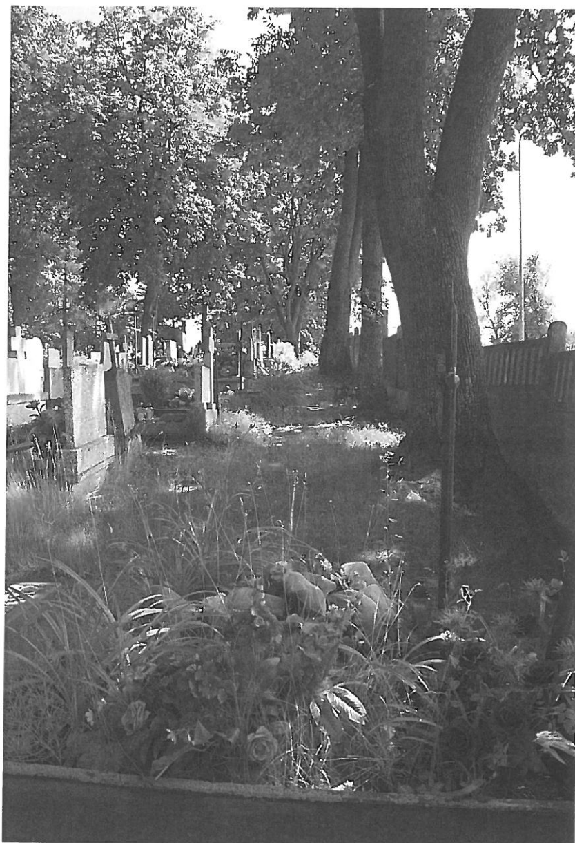
Usytuowanie pochówków i drzew w rejonie ogrodzenia.