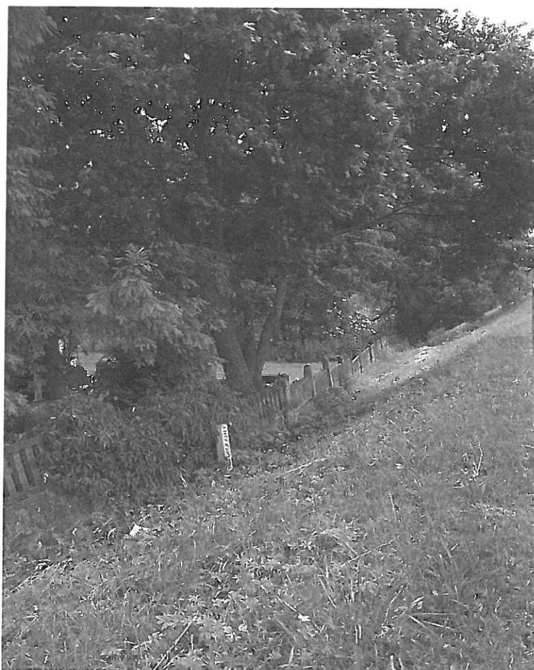
Widok obecnego ogrodzenia cmentarza w południowej części przy rzece.